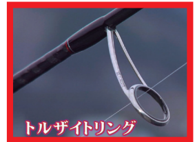
トルザイトリング

Length(ft) : 7'4" • LURE(g) : 0.6-10 • Line(lb) : 2-6 • PE.Line(号) : 0.3-0.8 • Action : EX. Fast • PRICE(¥) : 32,000