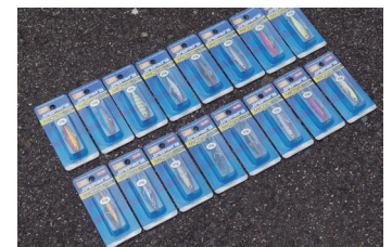
ジグヘッド：エコギア・アジジョンヘッド 活アジ

割れ、剥がれに非常に強い「5層マルチレイヤーコーティング」や、刺さりやすさと貫通性能に拘った、日本の職人製オリジナルフックを、3g・5gは動き重視のリアトレブル、7g・10gにはフロント&リアトレブルをセッティング。