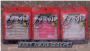
■メバル職人 メバダート1インチ