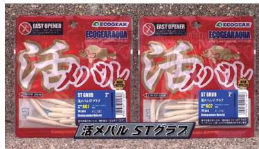
■活メバル ST グラブ

「メバル職人」シリーズは、メバルひとすじ、メバル釣りに特化したラインアップ。「ミノーSS」「ストローテールグラブ」「ストローテールグラブスリム」というメバルゲームに特に有効な3種類を用意。ベイトの種類や、その日の活性に合わせて幅広く使用できます。カラーは全国のメバルエキスパートたちがオススメする、こだわりの厳選色を用意。「メバル職人」シリーズはメバルゲームには欠かせないアイテムです。