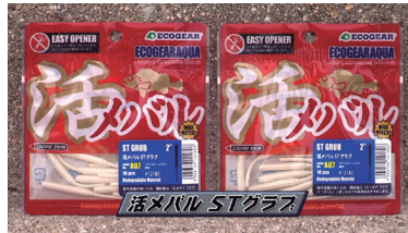
■活メバル ST グラブ

「メバル職人」シリーズは、メバルひとすじ、メバル釣りに特化したラインアップ。「ミノーSS」「ストローテールグラブ」「ストローテールグラブスリム」というメバルゲームに特に有効な3種類を用意。ベイトの種類や、その日の活性に合わせて幅広く使用できます。カラーは全国のメバルエキスパートたちがオススメする、こだわりの厳選色を用意。「メバル職人」シリーズはメバルゲームには欠かせないアイテムです。