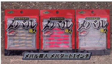
■メバル職人 メバダート 1 インチ